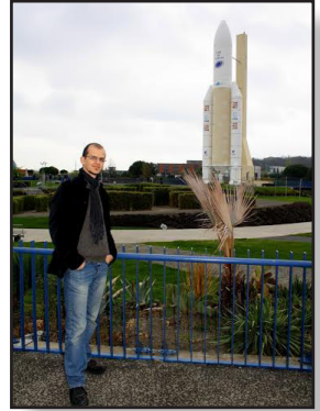
La Cité de l'Espace - Toulouse