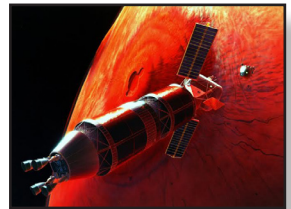
Marsminta-visszahozatal misszió (a jelenlegi munkám)