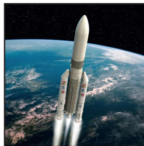
Ariane 5 - Legerősebb Európai hordozórakéta