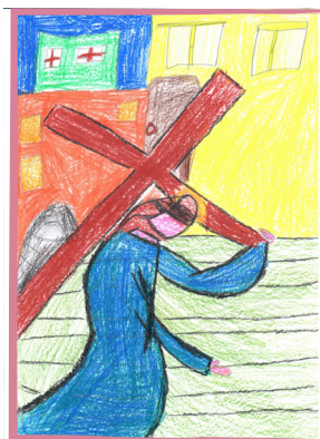
Híves Bálint (4. évf.)