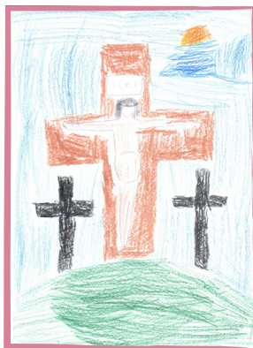
Csécés Dániel (1. évf.)