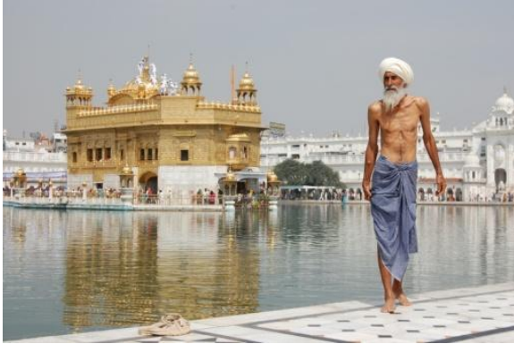
Szikh férfi az amritsari arany templom előtt

származástól és nemtől függetlenül bárki lehet a közösség tagja. Főleg a mai Pandzsab állam területén terjedt el, és jelenleg kb. 23 millió követője van. Szentírásuk a Guru Granth Sahib, melynek jelentése magyarul: Egyetlen Isten van.