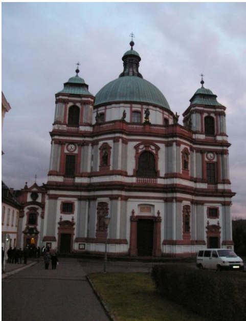
SZENT LŐRINC ÉS ZDISLAVA TISZTELETÉRE ÉPÜLT BAZILIKA

Szülőfalumból többnyire Magyarországra, Szlovákiába, vagy Lengyelországba szoktunk zarándokolni. Ezért most egy kevésbé ismert Észak-Csehországi búcsújáró helyről a cseh-német határ mentén fekvő Filipov – Philippsdorf – ról szeretnék röviden beszámolni.