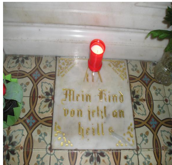
AZ EMLÉKTÁBLA A KÁPOLNA FŐLTÁRA ALATT

A múlt század 30-as éveiben ez a hely közép Európa leglátogatottabb búcsúhelye volt és joggal nevezték akkoriban Észak-Csehország Lourdes-ének. Élményekben, de főleg lelki és szellemi erővel föltöltve érkeztünk szerencsésen haza pénteken este január 13-án. Remélem sikerült soraimmal érdeklődést keltenem és megismertetni talán számunkra ezen kevésbé ismert kegyhelyet.