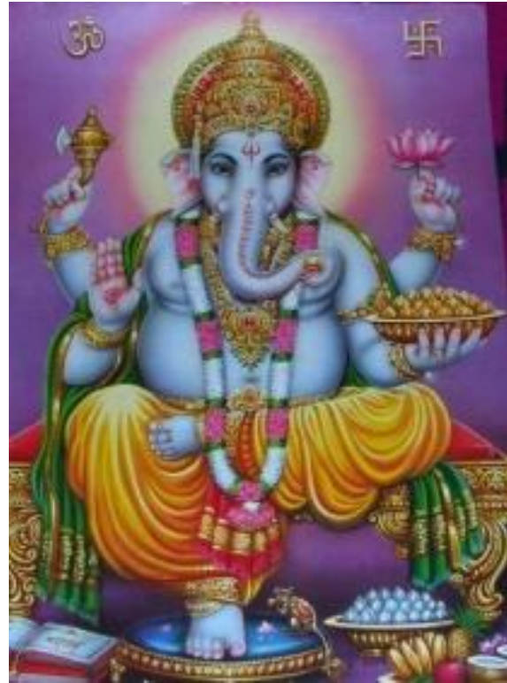
LORD GANESHA, HINDU ISTEN

ún. másodlagos isten a keresztény hitvallás angyalaival hozható párhuzamba; több mint 300 millió ún. félistenük van. A hindu vallás henotheista, vagyis egyetlen isten, az Egy, Abszolút létező imádása, a többi létezésének elismerése mellett.