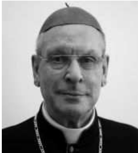
Mons. Baláz Rudolf beszercebányai megyéspüspök

Nem érdemes visszatekinteni arra ami volt, fontos, hogy a jelen pillanatra fordítsuk figyelmünket, mivel ez az egyetlen lehetőség, hogy az Úr akaratának éljünk és hívó szava után haladjunk. A jelen pillanat az, ami adott és ami közvetlen a rendelkezésünkre áll. Ez nyújt az embernek lehetőséget, hogy az Úrtól kapott szabad akaratát a mindennapi életben is érvényesíthesse és talentumait gyarapíthassa. Ezért nagyon fontos, hogy ne féljünk a zűrzavaros világ közepette sem az igazságosság útján járni, identitásunkat keresni és megőrizni, valamint életünket rábízni arra, akitől minden származik, a Mindenhatóra. Csak így munkálkodhatunk egy jobb és keresztény értékekre alapuló jövő kialakításán, amely minden ember kötelessége és küldetése.