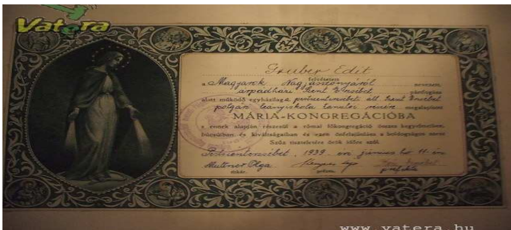
Felvételi bizonylat a Mária kongregációba