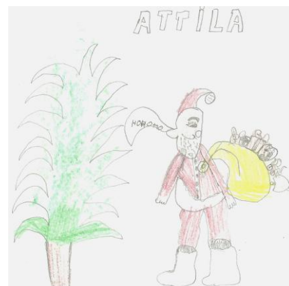
Molnár Attila (2. évf.)