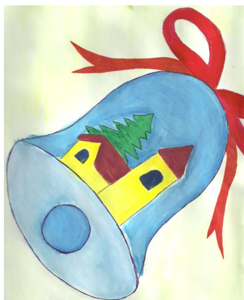
Balga Domnika (7. évf.)